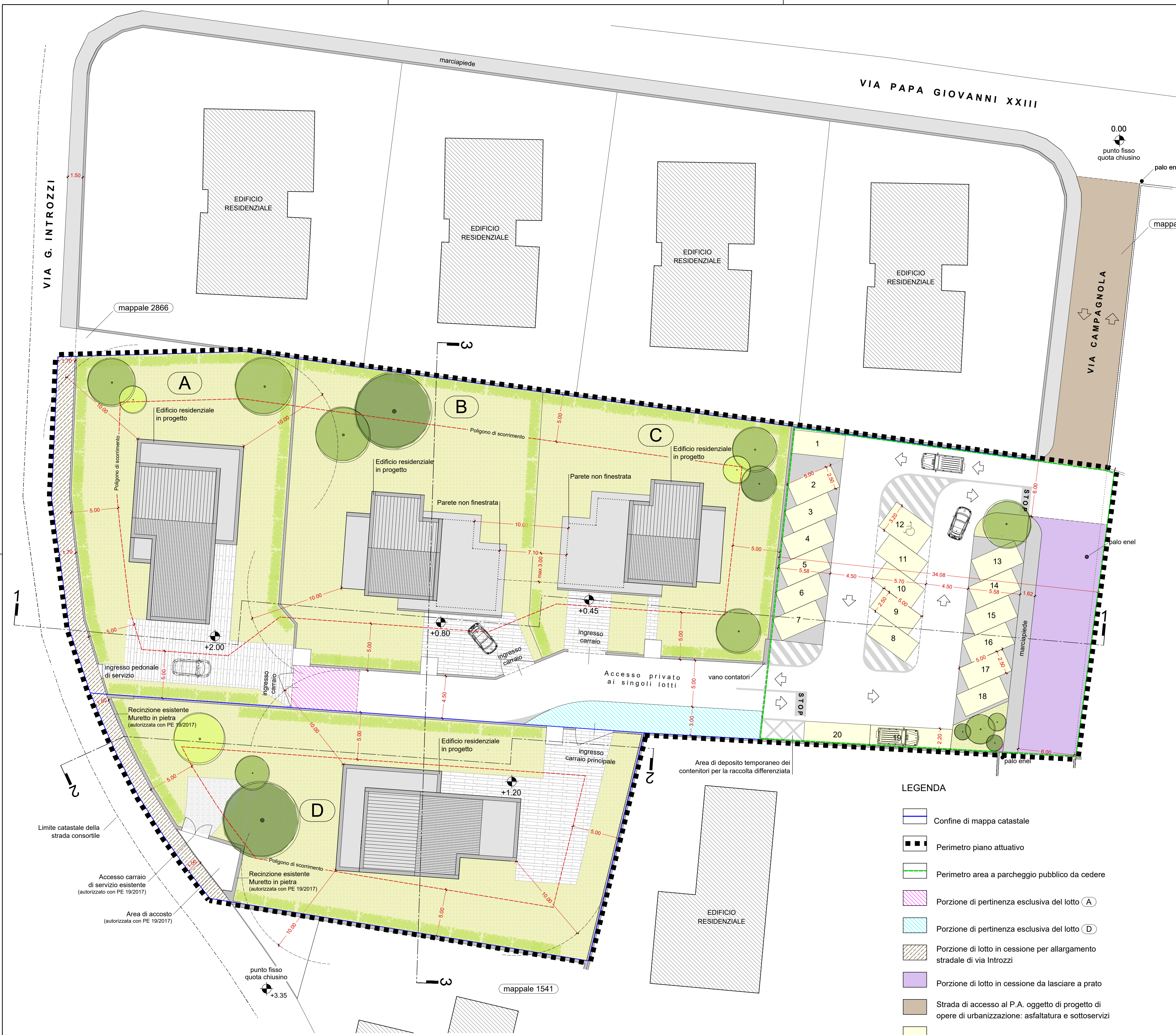
PLANIMETRIA - scala:1:200